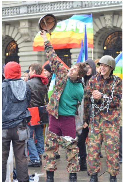
Dépôt des signatures, abolition de la conscription, janvier 2012

Si on enlève les femmes, les inaptes, les civilistes, les absents et les étrangers, il n'y a qu'une personne sur vingt qui fait effectivement l'armée en Suisse !