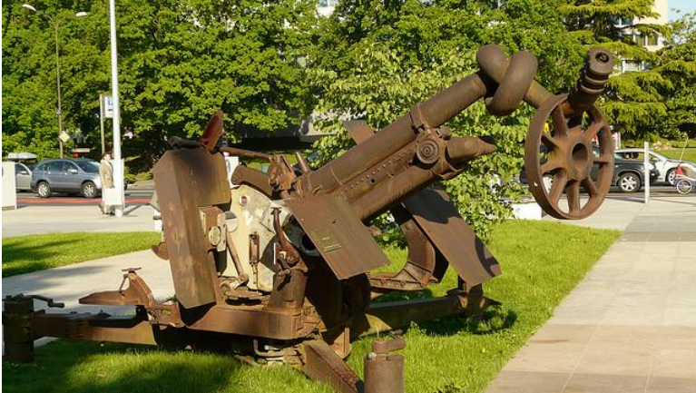
La guerre n'est pas une fatalité. Place des Nations. Genève